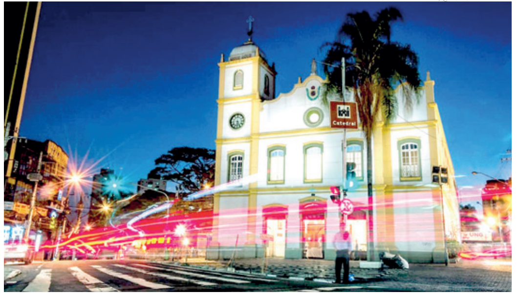
FÉ - Igreja Matriz, na região central, uma das mais antigas da cidade que remete a fundação de Guarulhos