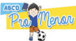
FIG-UNIMESP CENTRO UNIVERSITÁRIO CAMPUS VILA ROSÁLIA - GUARULHOS/SP