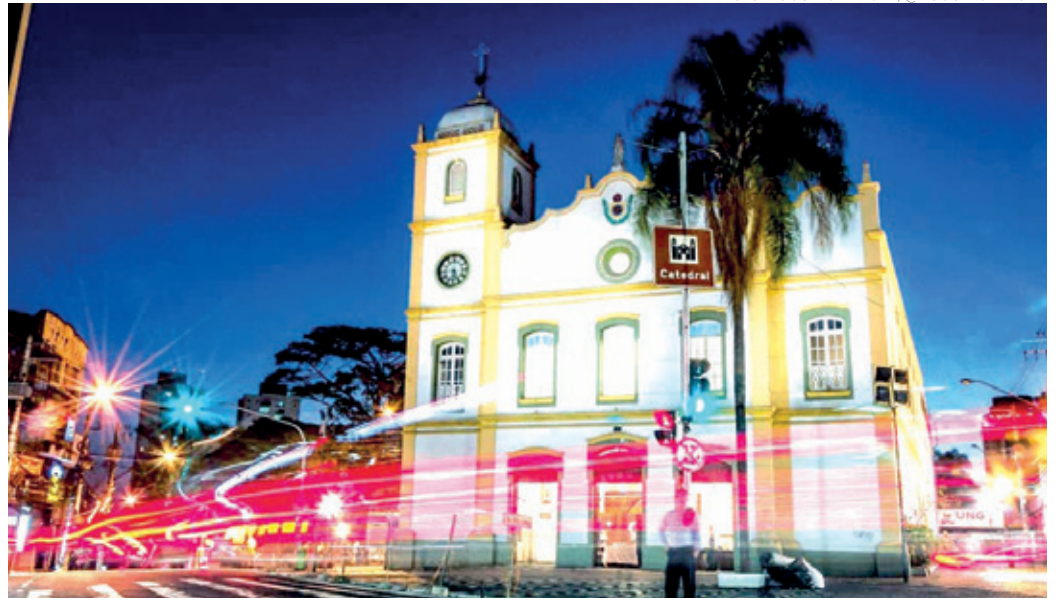
FÉ - Igreja Matriz, na região central, uma das mais antigas da cidade que remete a fundação de Guarulhos