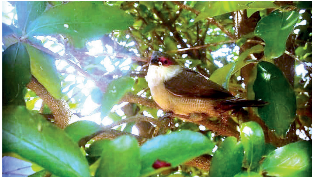
NATUREZA - Em meio as cidades os pássaros resistem com seu canto singular e beleza incomparável