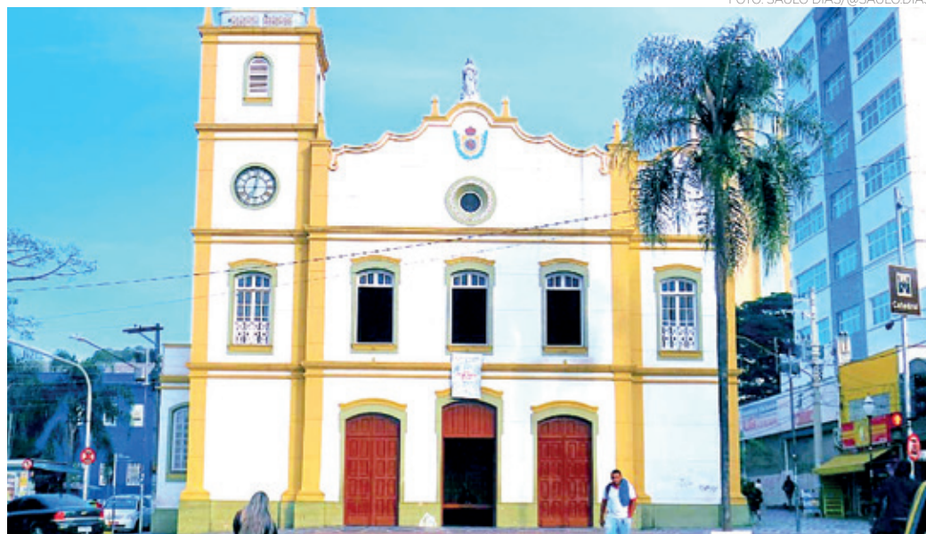
IGREJA - Importante cartão-postal da cidade a Igreja Matriz une história e fé no Centro de Guarulhos