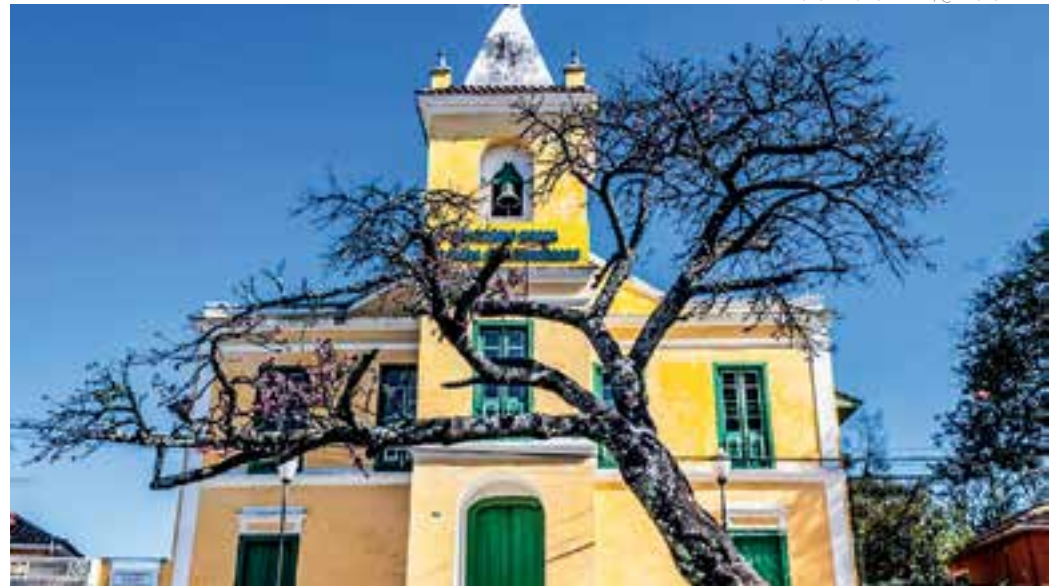
FÉ - Santuário Nossa Senhora do Bonsucesso: uma das igrejas mais importantes da cidade