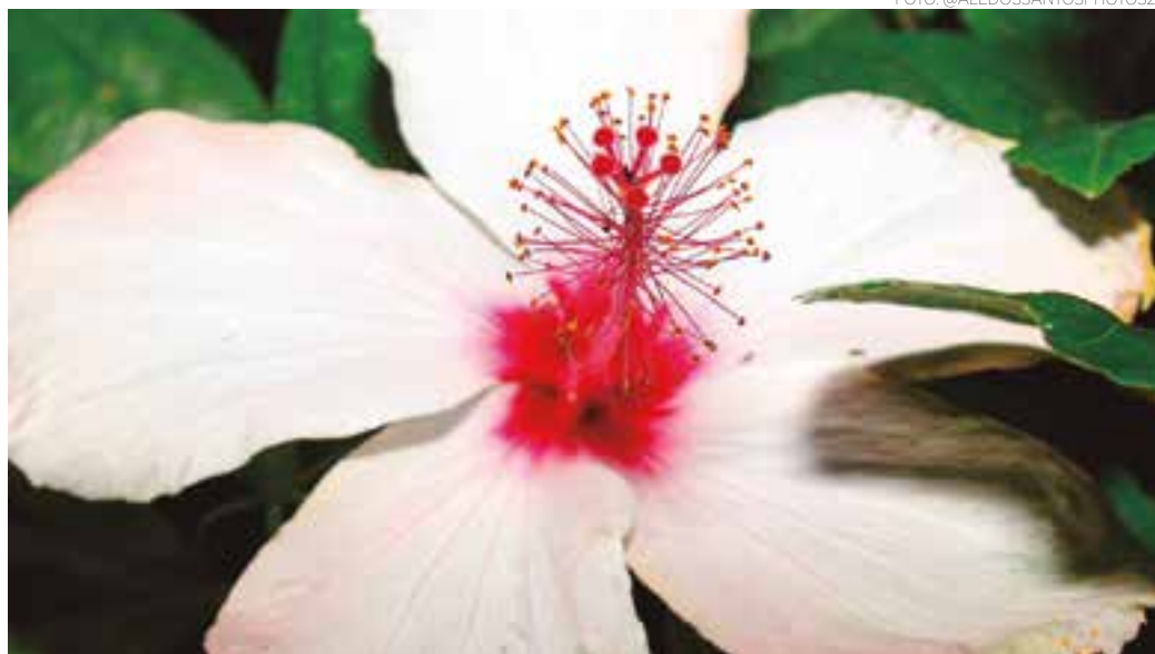
ESTAÇÕES - As cores e belezas da natureza estão presentes nas singularidades das flores em todas as épocas do ano