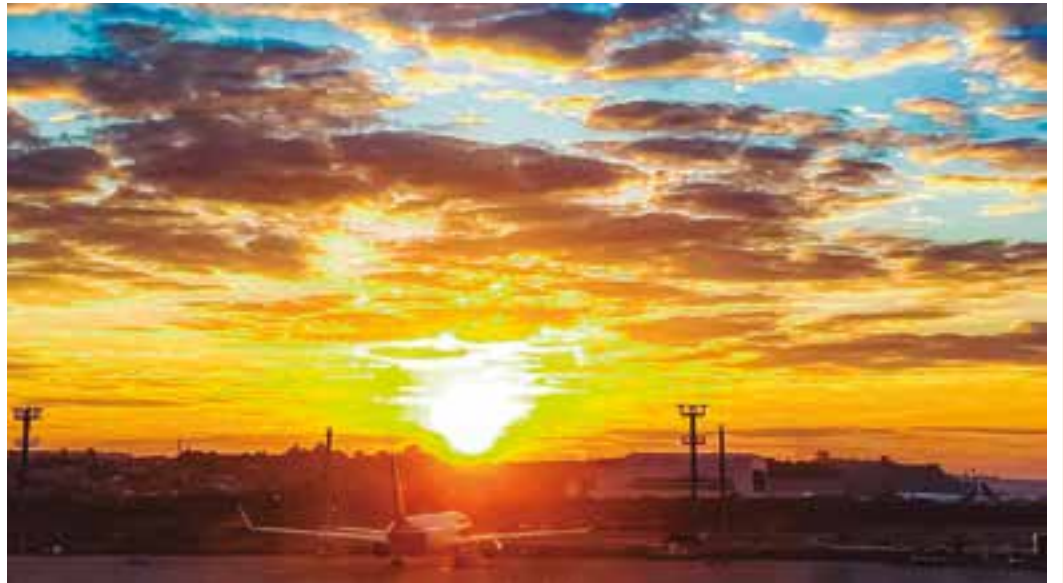
AEROPORTO - O fim de tarde no maior aeroporto do Brasil revela a grandeza e importância de Cumbica