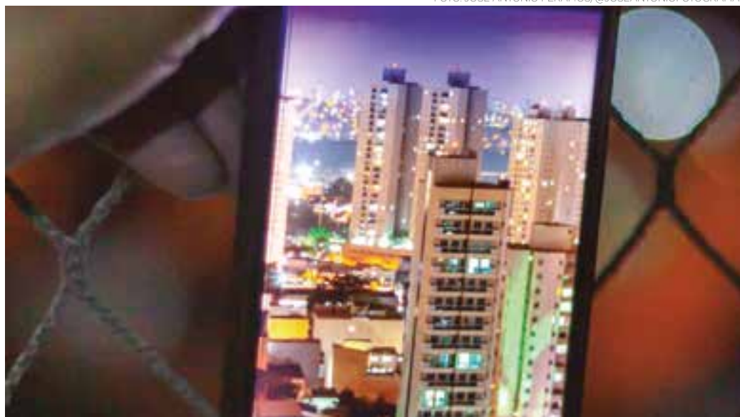
CIDADE - E ao longo dos anos a tecnologia vem aproximando todo o mundo através de um celular