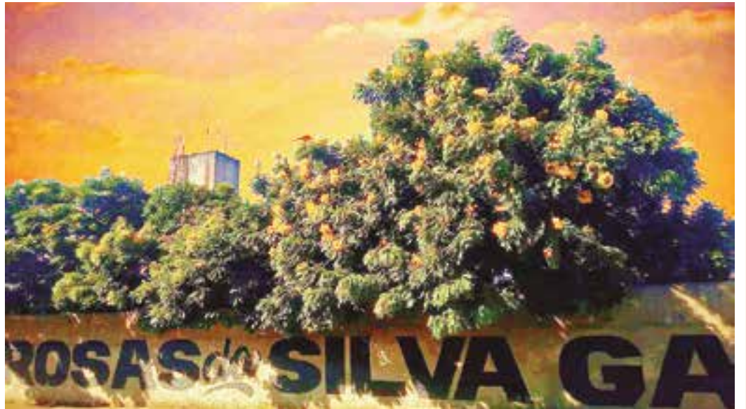
NATUREZA - E as belezas da natureza se fundem com as construções revelando os contrastes das cidades