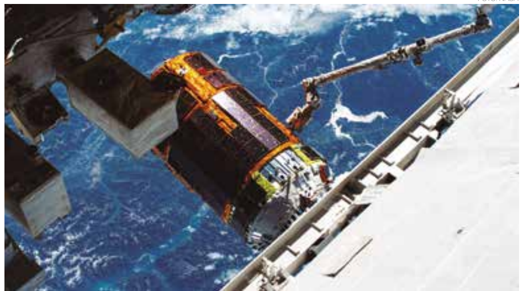
NASA - A nave de reabastecimento HTV-9 do Japão se afasta da estação espacial após colocá-la em órbita da Terra

Caro leitor, poste sua foto no Facebook ou Instagram com a #SuaFotoNaFolha. Se sua foto for a mais curtida, você poderá ganhar um super prêmio. Participe!